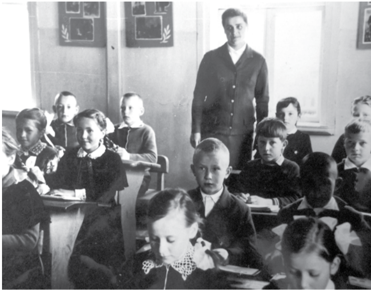
Butėnų pradinė mokykla. Pamoka...