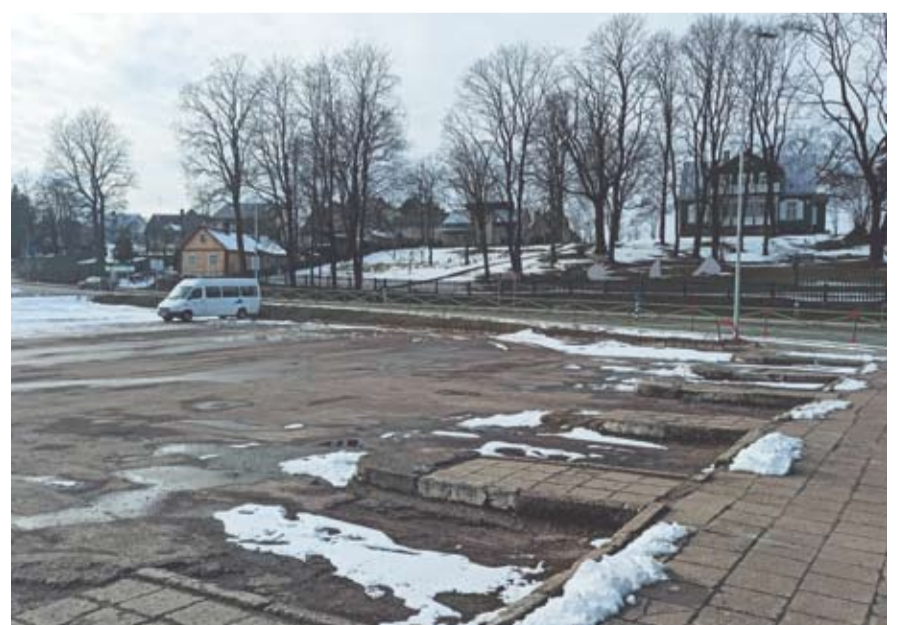
Autobusų stotis reikalauja didžiulio remonto ir solidžių investicijų.