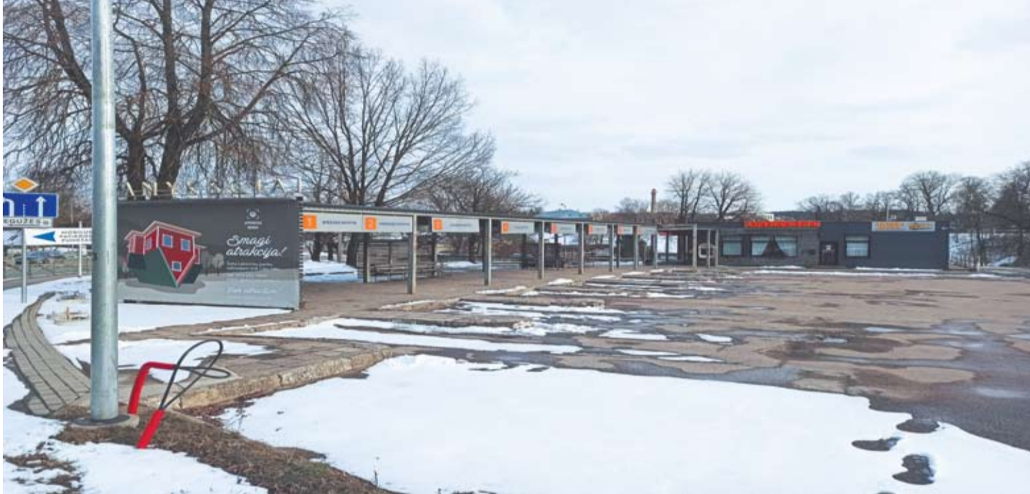
Anykščių autobusų stotį pagal sutartį su savivaldybe UAB „Autovelda“ nuomosis iki 2039-ųjų metų.

Pernai surengti Anykščių rajono savivaldybės ir UAB „Autovelda“ atstovų susitikimai dėl miesto autobusų stoties sutvarkymo vaisių nedavė. Savivaldybė tikisi, kad miesto nepuošiančią stotį sutvarkys privatūs investuotojai.