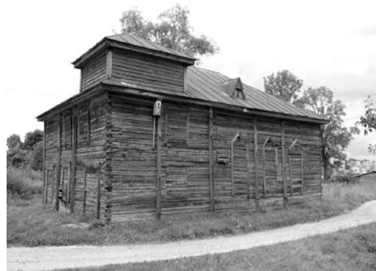
Prieš dešimtmetį tgi atrodė Kurklių sinagogos pastatas, kurio remontą planuojama baigti šiais metais.

Robertas ALEKSIEJŪNAS robertas.a@anyksta.lt