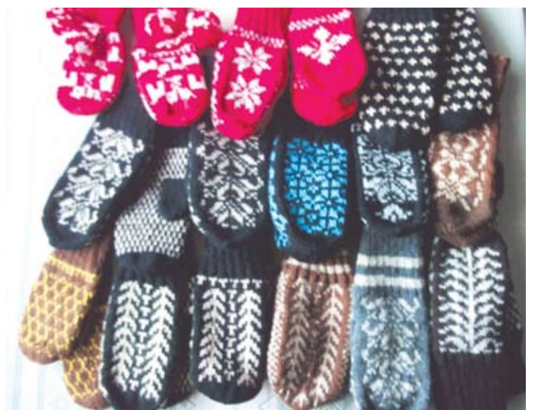
Raštuotas mokytojos margumynas.