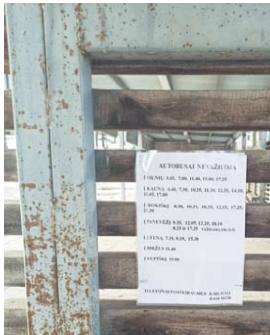
„Kovidinis“ Anykščių autobusų stotyje.