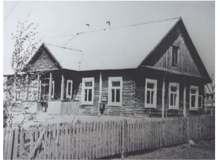
Mokyklos namai Butėnuose.